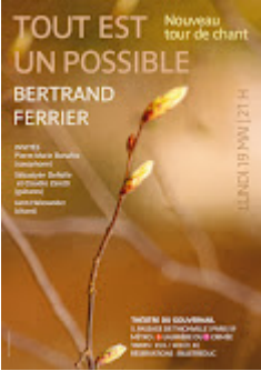
Affiche TOUT EST UN POSSIBLE.jpg 685K